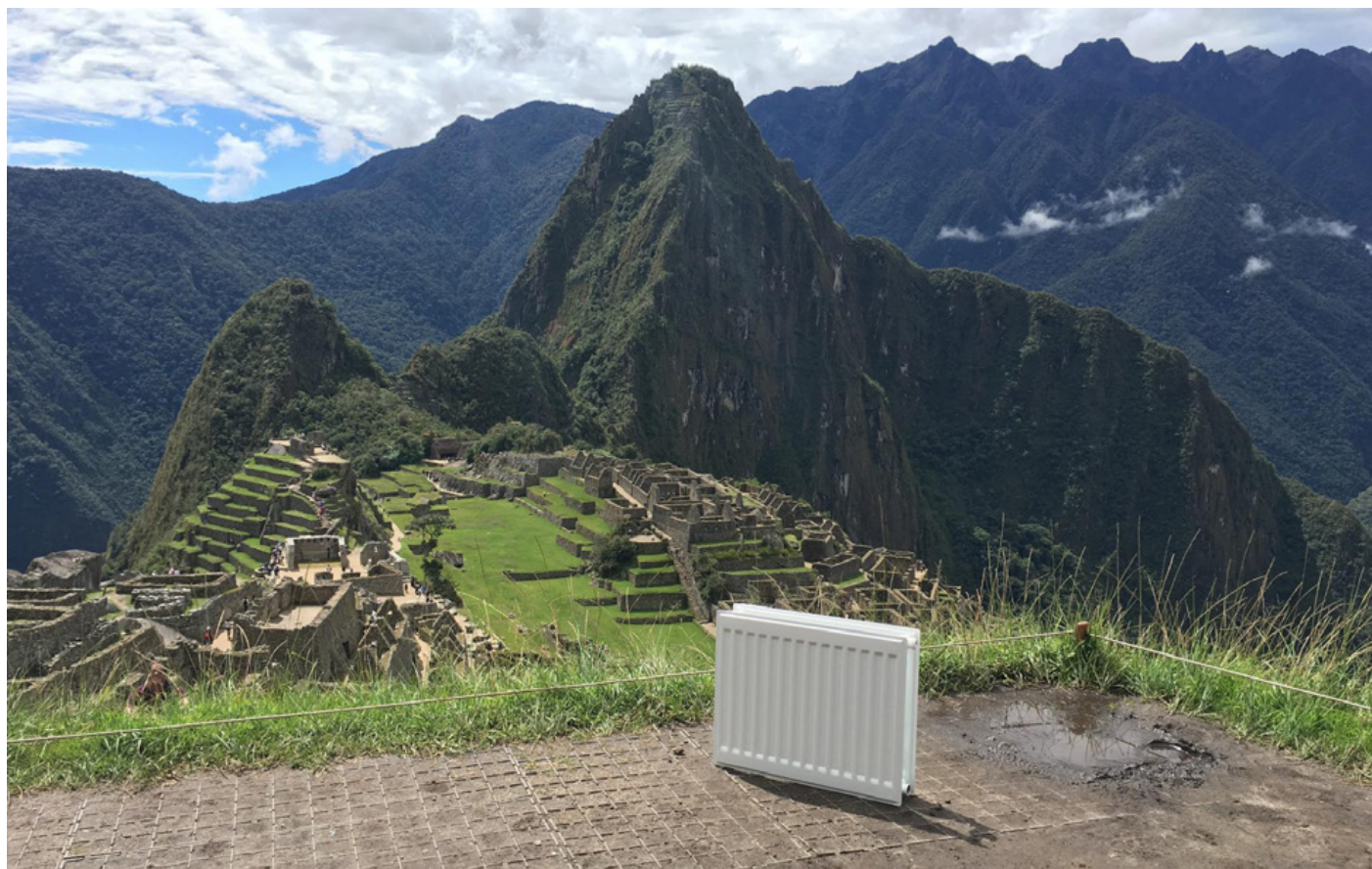
Magical Healing (detalj), 2016 © Brad Downey

I Stockholms läns landsting ska upp till 2% av byggkostnaderna gå till konstnärlig gestaltning. Konstanslaget finansierar projektet med att förvärva ny konst. En fördelning görs mellan beställda gestaltungsuppdrag och inköpta verk. Ambitionen är att skapa en gestaltungsmissig helhet som också fungerar för de enskilda sammanhangen. Konsten ska förstärka byggnadens karaktär, ge miljön en dignitet och tydlig visuell identitet. Den ska också möta ett mänskligt behov av kulturella uttryck.