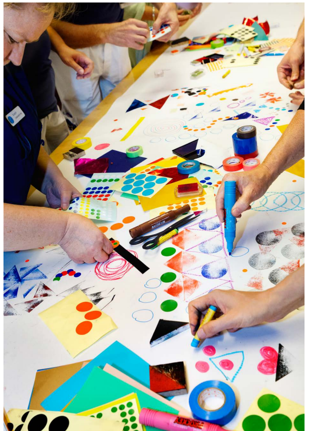
Workshop 2013 med personalen på akutmottagningen.