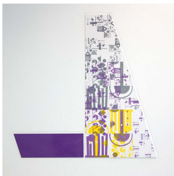
JAM, Miwa Akabane/BUS2016.

En del av verket består av keramiska plattor som bildar en nästan fyra meter lång bild med associationer till årstiderna. Samma mönster, material och färger återfinns i den intilliggande trapphallen men i andra former och format.