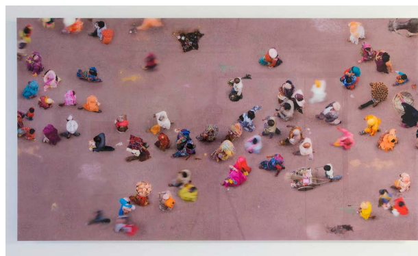
Vrindavan , Katrin Korfmann/BUS 2014.

Vårdavdelningarna på entréplanet och plan 1 har gestaltats med VäderLekar av Thomas Henriksson . Konstnären har velat skapa en atmosfär av koloristisk lätthet med färgval som dessutom kan underlätta orientering i huset. Verken är landskap i olika grad av abstraktion, uppbyggda av tjocka färglager som konstnären gjort spår och ristningar i. Varje avdelning har sju oljemålningar placerade på ena sidan av de två korridorerna. På andra sidan, där det finns lysrör, hänger plexiglasbilder ett par centimeter ut från väggen vilket indirekt belyser dem bakifrån. På så sätt aktiveras hela korridoren.