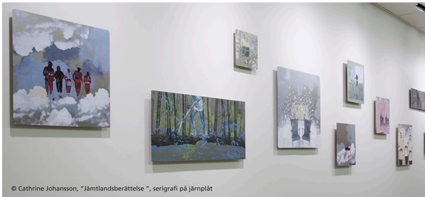
© Cathrine Johansson, "Jämtlandsberättelse", serigrafi på järnplåt

Smärtklinikens lokaler består av två parallella korridorer som likt ett H binds samman på mitten av det avlånga väntrummet. Där sitter patienterna utmed den ena långväggen och därför är den motsatta väggen den perfekta platsen för ett vidsträckt och berättande konstverk som betraktaren kan försjunka i. Valet föll på Cathrine Johanssons blandade minnesbilder från förr och nu, sanna och osanna berättelser.