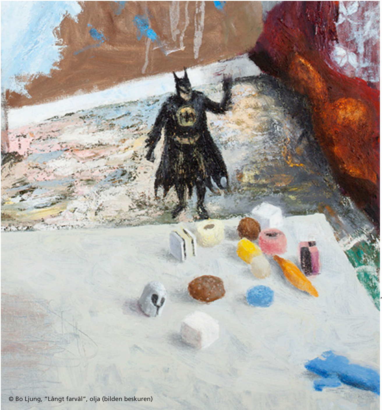
© Bo Ljung, "Långt farväl", olja (bilden beskuren)

Smärtcentrum, Karolinska Universitetssjukhuset Solna