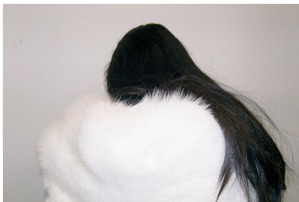
Ur serien Landscapes, Greenland (2008)

På varsin våning har Mattias Åkerfeldt och danska Eva Marie Rødbro gestaltat ett glasparti. Bilderna på glaspartierna ingår i deras fotografiska serier som även binder ihop båda våningsplanen. Rødbro och Åkerfeldt utforskar ensamhetens natur. Deras verk står i direkt dialog med varandra och blickar ut mot nya horisonter.