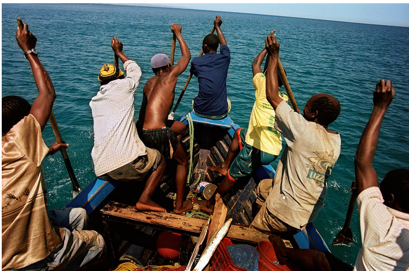
© Sergio Santimano, Pescadores, Metangula (Lago Niassa) Mocambique (2002)

Framtidens vårdavdelning, samt anslutande hisshallar, Karolinska Universitetssjukhuset Huddinge