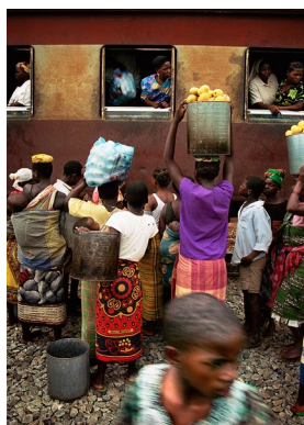
Xitimela (comboio) Cuamba-Nampula, Mocambique (2002)

Vid entréerna till vårdavdelningarna på plan 6 och 7 (M 61-63 och M 71-73) möts besökarna av skulpturer av Sirous Namazi och Veronica Brovall. I Namazis "Patterns of Failure" blir det sönderslagna och oanvändbara porslinet ett slags minsta beståndsdelar som han sammanför och upprepar till nya förslag på struktur. Vardagsföremålen som förlorat sitt ursprungliga syfte ges en ny innebörd.